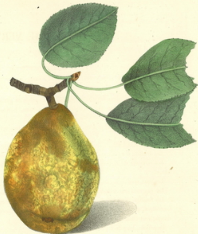
POIRE ENFANT PRÉCOCE (S. de H. de M.)