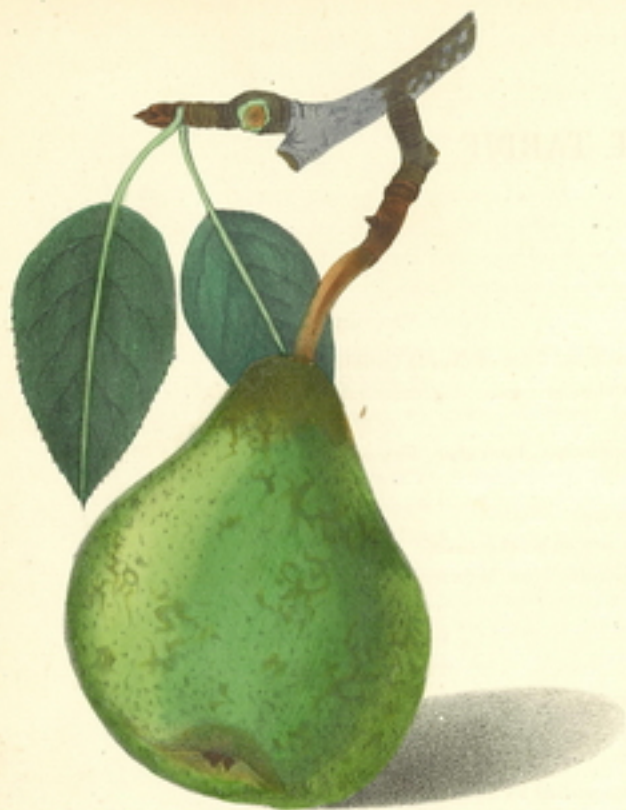
POIRE REVERÉ VERT TARDIF.