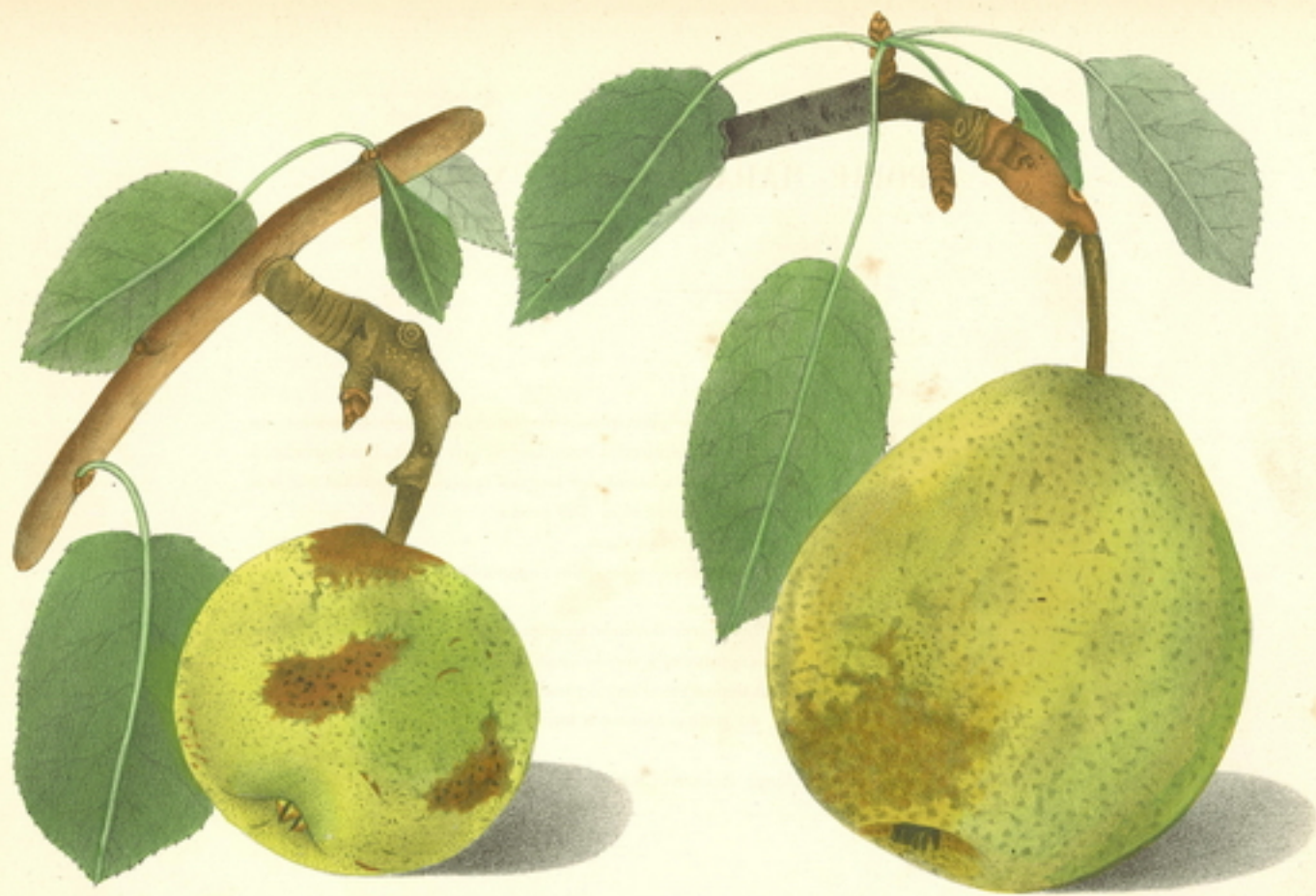
POIRE MADAME D'URCEUX .