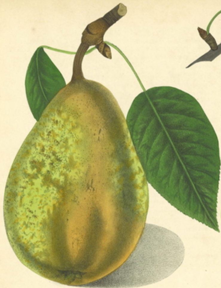
POIRE VAN HONS (Com. Leclerc.)