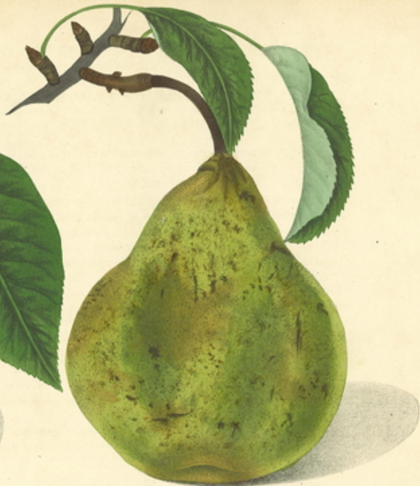
POIRE LÉON LECLERC DE LAVAL (Van Hous.)