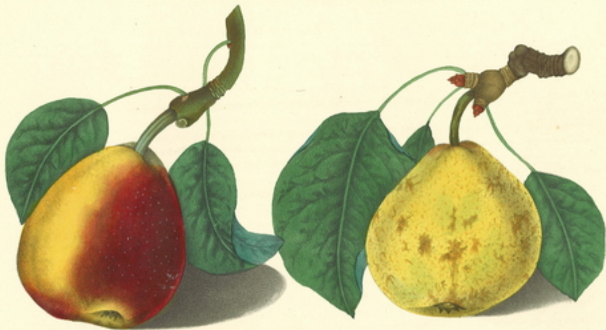
SECKLE PEAR (Van Sæhle.)