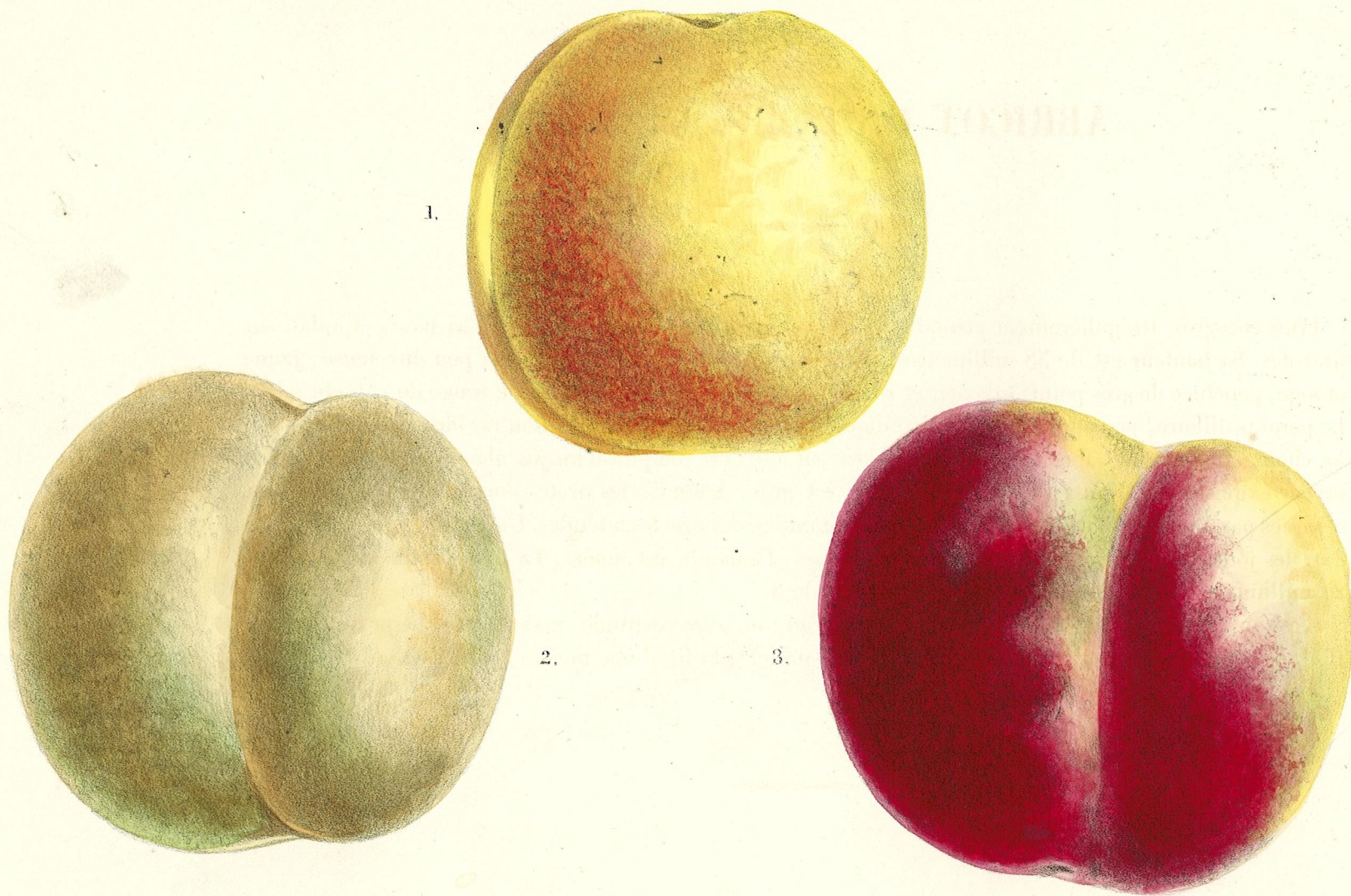
1. ABRICOT GROS ROUGE HÂTIF.